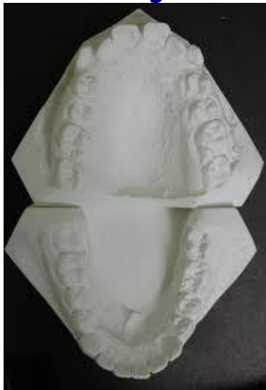
Een voorbeeld van een gipsmodel

Hij maakt een beugel die speciaal bij jou past.