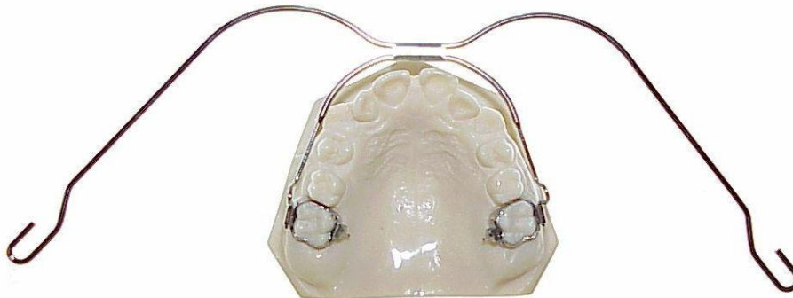
Voorbeeld van een buitenbeugel

Een activator zet de kaken recht op elkaar. Een plaatbeugel doet hetzelfde als een blokjesbeugel.